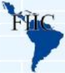
RELACION DE TEMAS SOLICITADOS A LAS CÁMARAS MIEMBROS FIIC EN EL 2012