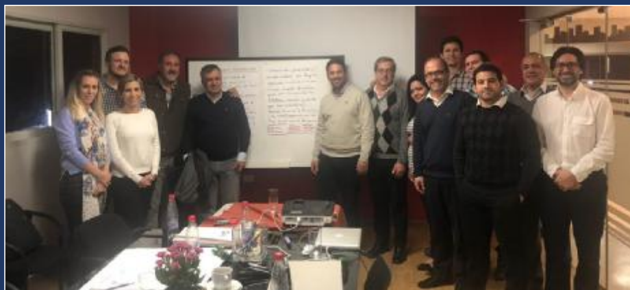
CAPACO en trabajo con la OIT